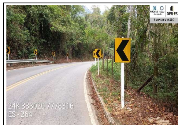
Implantação de sinalização vertical