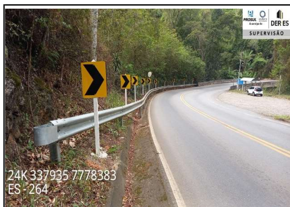
Implantação de sinalização vertical