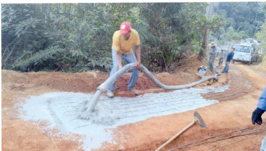
Início da concretagem 10/07/2018