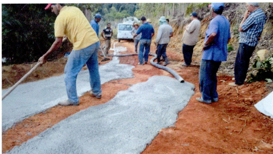
Início da concretagem 10/07/2018